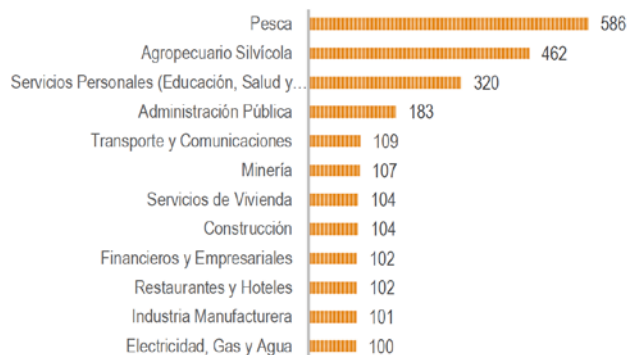
Ilustración 3: Los Lagos. Publicaciones por entorno productivo