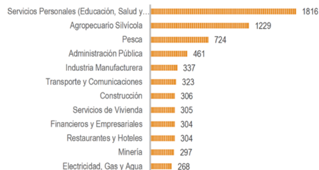
Ilustración 1: La Araucanía. Publicaciones por entorno productivo

En un punto de equilibrio entre ambos aspectos se encuentran las publicaciones sobre Minería, Electricidad, Gas y Agua, Agropecuario Silvícola y Administración Pública (Data Ciencia, 2021)