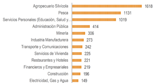
Ilustración 2: Los Ríos. Publicaciones por entorno productivo

Por su parte, las publicaciones en las áreas de Agropecuario Silvícola y Pesca se orientan hacia las capacidades regionales en I+D , mientras que aquellas referidas a Restaurantes y Hoteles se inclinan hacia los desafíos productivos en I+D (Data Ciencia, 2021).